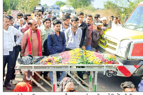
पर पहुंचे पुलिस बल और प्रशासनिक अधिकारियों ने परिजनों को समझाने का प्रयास किया, लेकिन परिजनों का कहना है कि प्रदर्शनकारी आरोपियों की गिरफ्तारी और सख्त कार्रवाई की मांग पर अड़े रहे। परिजनों का कहना है कि

प्रदर्शनकारियों ने मांग की है कि दोषियों पर तत्काल हत्या (धारा 302) का मामला दर्ज किया जाए और उनके अवैध निर्माणों पर प्रशासन का बुलडोजर चलाया जाए। चक्काजाम के कारण बायपास के दोनों ओर वाहनों की लंबी कतारें लग गईं, जिससे यात्रियों को भारी परेशानी का सामना करना पड़ा। मौके