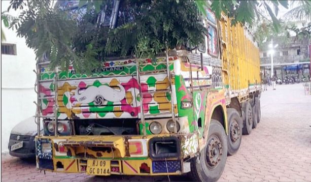
GC 0144 से गुना आए थे। ट्रक चालक दिनांक 16 फरवरी 2026 को ट्रक लेकर गुना आया तो उसमें से पशु आहार के 500 कट्टे उतार लिए थे बाद में पुनः 100 कट्टे और ट्रक में भरकर कुल 200 कट्टे दैनिक किराना बेरखेडी के यहां उतारने के लिए ट्रक चालक को भेजा था जो कि ट्रक चालक ने पशु आहार के 200 कट्टे कीमती करीबन 03 लाख रुपये उक्त पते पर न पहुंचाते हुए कहीं और ले गया जिस पर से गुना कोतवाली में अप.क्र. 91/26 धारा 316(3) बीएनएस के तहत अपराध दर्ज कर विवेचना में लिया गया था। अमात में खयात किये जाने के उपरोक्त प्रकरण के आरोपी ट्रक